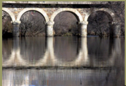
Puente de entrada al pueblo, aquí el río Tera aún conserva la transparencia de sus aguas.